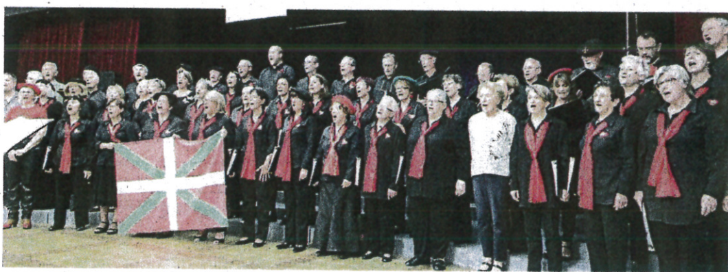
« Hegoak » chant fétiche !

La chorale A Croche Cœur a fêté ses trente ans à la salle des fêtes en offrant à son public un concert entraînant. 2017, ce sont les noces de perle. Leur amour n'a jamais faibli et leur passion pour la musique et pour leur public est toujours aussi vive. Année après année, ils ont poli leurs voix avec patience et volonté, ils ont recouvert, répétition après répétition, d'une belle couche de nacre le talent brut de leurs choristes... Que de travail accompli et quelle réussite ! Durant cette soirée, toute en émotions, ont été évoqués les quatre présidents et les quatre chefs de chœur qui se sont succédé. Né en 1978 à Toulouse,