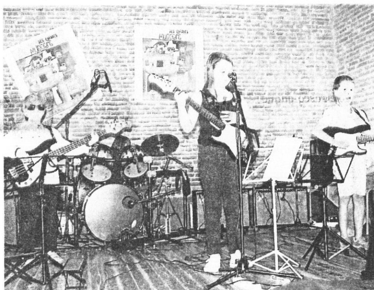
L'école de musique est une pépinière de jeunes talents.

Ce sont près de 50 enfants musiciens de tout âge allant de 8 ans à 50 ans qui seront sous les feux de la rampe dans une ambiance conviviale. À 19 heures, un apéro jazz sera proposé et, après la tombola de 21 heures, Christophe Hernandez propo-