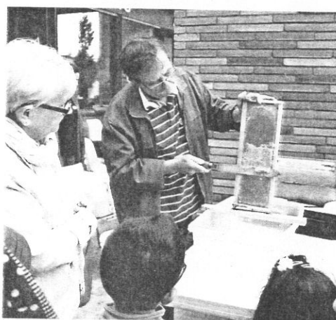
Les premières animations apicoles auront lieu le matin sur la place de la Libération.

Programmée dimanche, la fête se décomposera en deux parties. De 10 h 30 à 12 h 30, plusieurs animations se tiendront sur la place de la Libération : extraction et dégustation de miel en public, présentation d'une ruche vitrée pour découvrir la vie intime d'une colonie, expositions et courtes lectures exécutées par l'association Vent de mots. Puis, à partir de 14 heures, apiculteurs et public se déplaceront sur le terrain du rucher. Jusqu'à 18 heures, des animations proposées par la mairie,