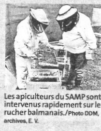
Les apiculteurs du SAMP sont intervenus rapidement sur le rucher balmanais.