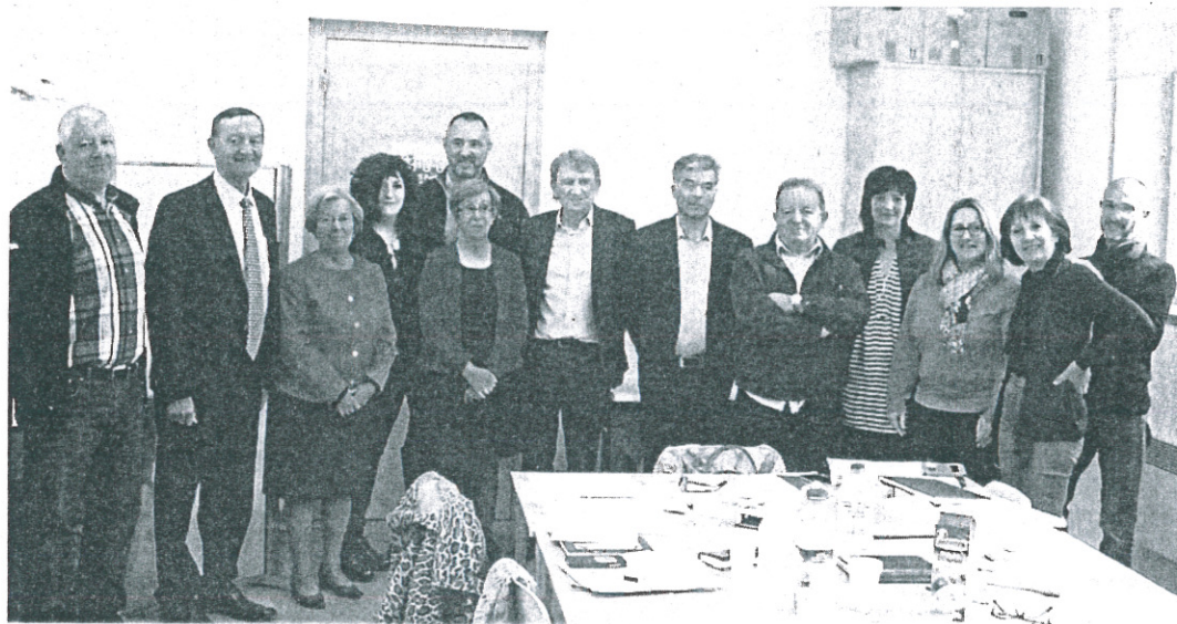
Petite pause pour les acteurs du projet, aux côtés des élus.

Y sont également associés, côté français, l'association Marie-Louise, la commune de Pechbonnieu, le lycée professionnel de l'Oustal, le conseil départemental de Haute-Garonne et de