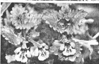
En haut la pâquerette et le plantain. Dessous, la consoude et le lierre terrestre.

France a la chance d'avoir conservé énormément de documents à ce propos ». Le jardin ajoute-t-elle « offre l'espace d'une relative indépendance pour subvenir à des besoins fondamentaux comme se nourrir et se soigner ». Alors oui, on peut les cultiver mais aussi profiter de la multitude sauvage qui pousse à proximité, sous condition qu'elle ne soit pas polluée.