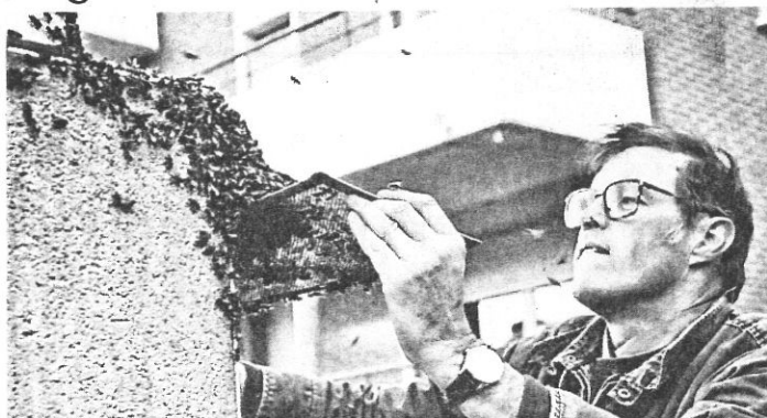
Un essaim d'abeilles en court de déménagement a fait une halte sur un poteau de la rue Kruger.