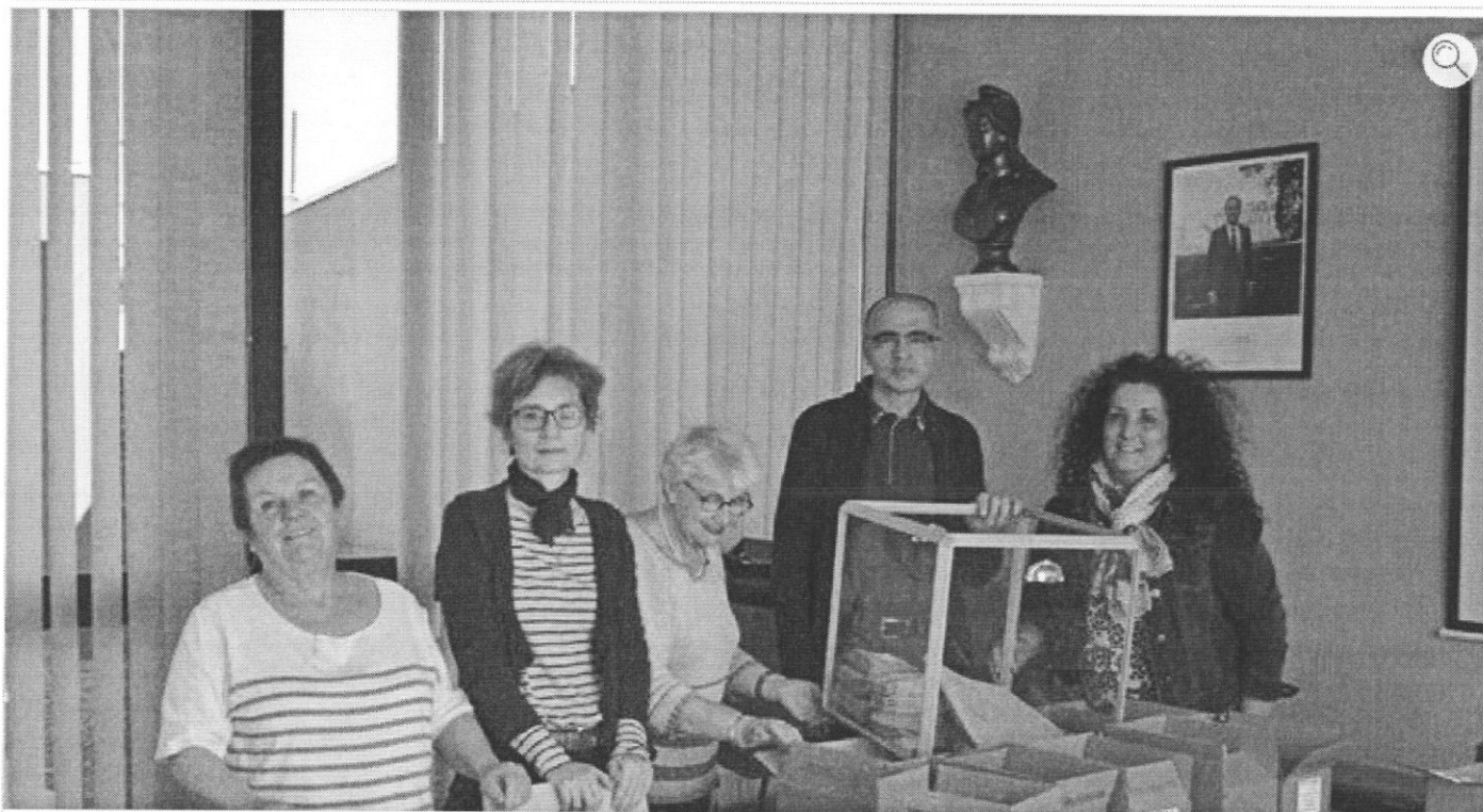
Hier matin en mairie le service chargé des élections continue les préparations.

Désormais 10 bureaux (au lieu de 8 précédemment) sont ouverts aux Saint-Jeannais pour le vote de l'élection présidentielle de dimanche (et toutes les autres élections). Cela redistribue, pour certains, le lieu où voter. Il est donc conseillé aux électeurs de bien regarder leur carte où est notée l'adresse pouvant préciser le changement éventuel de leur bureau de vote. À défaut de réception de la carte électorale il est possible de passer en mairie pour connaître l'adresse de son bureau de vote samedi de 10 heures à 12 heures et dimanche toute la journée.