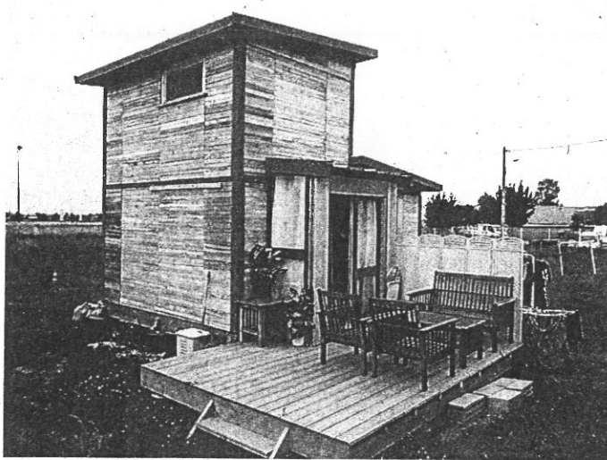
Le projet test de Toit et Cie, testé par les Compagnons d'Emmaüs depuis 2015.

Le projet Toit et Cie a germé il y a huit ans dans l'esprit des bénévoles de l'atelier chantier d'insertion Bois et Cie. La société est aujourd'hui capable de créer entièrement des logements modulables de 20 et 35 mètres carrés, prêts à être habités, et montés en seulement dix jours. « La modularité permet de réaliser de nombreuses choses différentes comme des stands, des blocs sanitaires etc. Sur les maisons, elle permet d'adapter l'aménagement, la position des fenêtres... » indique Chloé Vienot, coordinatrice du projet. Entièrement créé à partir de matériaux écologiques et de bois de charpentes locales, il s'inscrit dans une démarche environnemen-