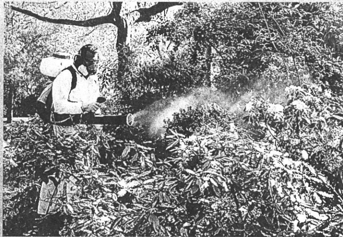
Des jardiniers volontaires des parcs et jardins de la Ville de Toulouse sont chargés du traitement des buis.

Depuis avril 2015, Toulouse utilise un produit biologique, le bacillus thuringiensis , préconisé par la Fédération Régionale de Défense contre les Organismes Nuisibles. Néanmoins, les parcs doivent rester fermés car, bien que non agressif pour la flore, le produit peut engendrer des irritations s'il entre en contact avec la peau.