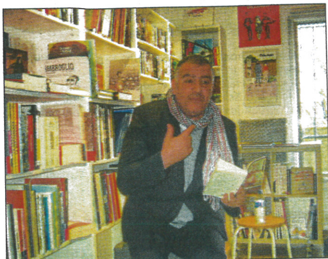
Magyd Cherfi lit un extrait de « Ma part de Gaulois »