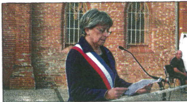
Le discours de Mme le Maire devant le Monument aux Morts

Dimanche 19 mars, la municipalité de Saint-Jean commémorera le 55ème anniversaire du cessez-le-feu de la guerre d'Algérie. Rendez-vous à 10h15 devant l'Hôtel