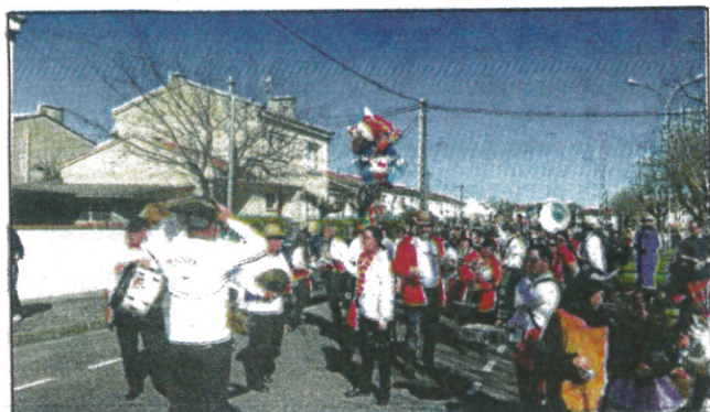
En avant la musique!

Ce samedi 18 mars aura lieu la 3ème édition du Carnaval organisé par le Comité des Fêtes. Rendez-vous à 15h30 sur le parking rue Rimbaud, face au futur bâtiment