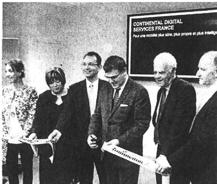
Christophe Sirugue, secrétaire d'État à l'industrie, était hier dans les locaux de Continental Automotive.

Pour mener à bien cette entreprise synonyme d'un investissement compris entre 200 et 300 millions d'euros sur cinq ans, le groupe prévoit d'embaucher à Toulouse une cinquantaine de personnes dans les prochaines semaines, 150 d'ici fin 2017 et à terme plusieurs