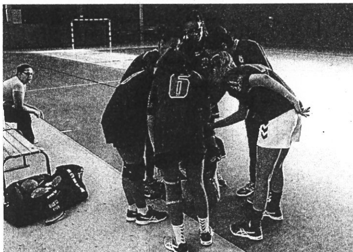
Solidarité permanente chez les -15 Filles

Les -18 garçons 1, vainqueurs à Saint-Gaudens 27 à 25, finissent malgré tout seconds de leur poule Excellence A départemental, derrière Beaulzelle, au point average. L'équipe 2 elle, n'a rien pu faire face à Pins-Justaret, défaite 27