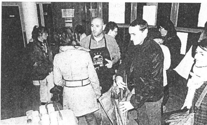
La Ruche qui dit oui, c'est aussi un lieu de convivialité.

En un an, près de 46 distributions ont permis à 168 foyers de s'approvisionner en direct auprès d'agriculteurs et artisans situés en moyenne à 33 km du lieu de distribution. 26 producteurs actifs ont confectionné près de 993 paniers. Le choix des membres de soutenir cette forme de circuit court et social a permis de récolter 31 270 €. Pour célébrer cet engagement