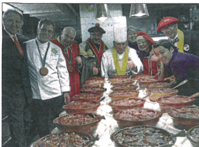
Qu'y a-t-il au menu? Des haricots!