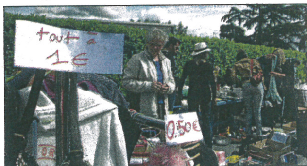
Un vide-grenier toujours très couru

Dimanche 21 mai aura lieu le traditionnel vide-grenier organisé conjointement par les clubs de foot et de basket, sous l'égide de la mairie de Saint-Jean. Les inscriptions se feront au club-house du foot, impasse Roger Pujol (face au collège), unique-