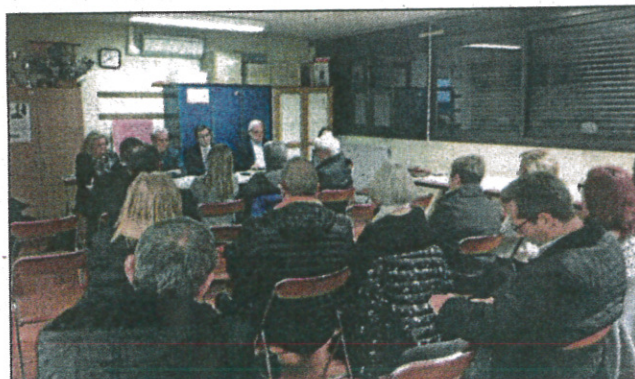
Une réunion sérieuse et constructive