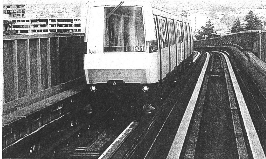
Un métro en aérien, au sol, sur 40 % de la ligne, à l'ouest de la Garonne et à l'est de Montaudran.

« Les 40 % aériens ne pourront pas tous se faire en ras du sol (ne serait-ce que pour la traversée de la Garonne et des voies rapides), le montant communiqué par Tisséo est grandement sous-estimé. Le projet actuel tourne plutôt autour de 2,5 milliards »,