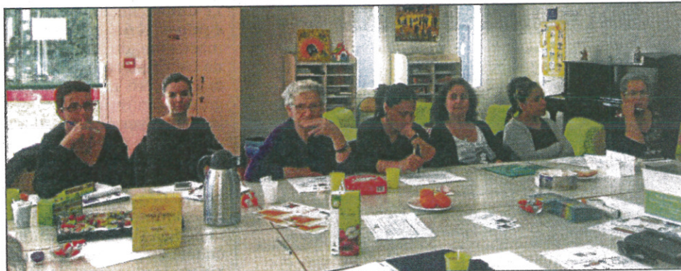
Quand "atelier" rime avec "convivialité"

Lundi dernier, le Centre Social proposait un atelier « Consommer autrement », en partenariat avec la Maison des Solidarités, le CCAS de l'Union et le service Info Energie de Toulouse Métropole. Comment réduire sa facture énergétique ? Calculer la quantité d'énergie utilisée par un appareil, choisir si possible la bonne source d'énergie (l'électricité coûte beaucoup plus cher que le gaz, le fioul ou le bois), comprendre ses factures... autant d'informations qui vont permettre de faire les bons choix (achat d'appareils électroménagers, d'ampoule...) et surtout d'adopter les bons gestes : repérer les fuites d'eau, faire fonctionner les appareils aux heures creuses (indiquées sur les facture