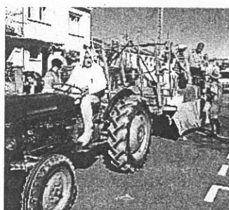
Le carnaval reste l'une des dates majeures pour l'animation de la commune.