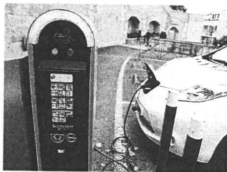
On pourra recharger sa voiture au village.

Grâce au concours de l'Etat via les investissements d'avenir (50 %) et du SDEHG (35 %), la commune prend à sa charge seulement 15 % du coût de l'installation, soit environ 1000€.