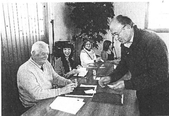
Renouvellement des cartes, à l'issue de l'assemblée

L'association francophone d'api et phytothérapie, qui a son siège à Auterive vient de réunir ses membres pour l'assemblée générale.