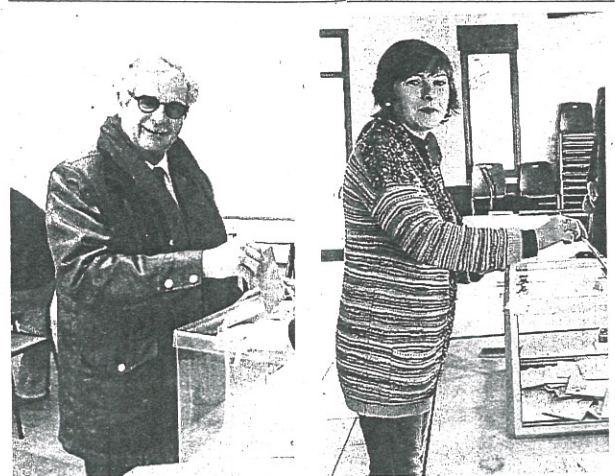
Georges Méric et Carole Delga ont voté à Nailloux et Bousens.