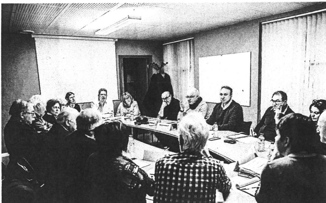
Dix maires du nord toulousain de tous bords se fédèrent pour améliorer les déplacements urbains et les infrastructures routières de leur territoire.

« On a perdu le nord ! » s'exclament régulièrement les élus du nord toulousain en consultant les futurs aménagements urbains et projets d'infrastructures routières de ce territoire prévus par la Métropole et autres instances dirigeantes. Si la formule prête à sourire, elle n'en reste pas moins empreinte d'un certain ressentiment. Après avoir suffisamment alerté sur les problèmes liés à leur territoire, dix maires, de toutes sensibilités politiques, estiment ne pas être assez entendus. Les solutions apportées pour les années futures ne sont pas à la hauteur des enjeux. Ils ont donc décidé de mettre en place un groupe de travail pour élaborer des solutions communes et peser dans les décisions. Réunis à Fenouillet en décembre, ils se sont retrouvés fin janvier à Lespinasse pour une deuxième réunion de travail. Ils souhaitent établir leurs priorités pour la prochaine décennie. Les villes d'Aucamville, Castelginest, Bruguières, Fenouillet, Gagnac-Sur-Garonne, Saint-Alban, Fonbeauzard, Saint-Jory, Gratentour et Lespinasse devraient parler prochainement d'une seule et même voix sur la question du développement des dessertes