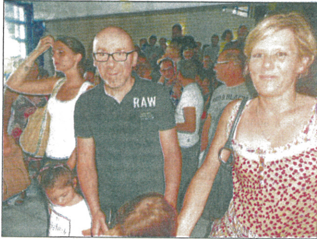
Les parents ont apprécié la soirée !