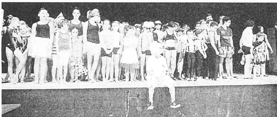
« Albert Einstein », au bord de la scène, a animé le gala à l'Espace René-Cassin.