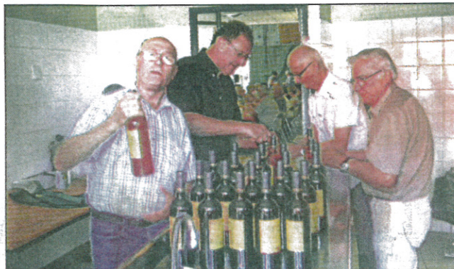
En cuisine, la symphonie des bouteilles