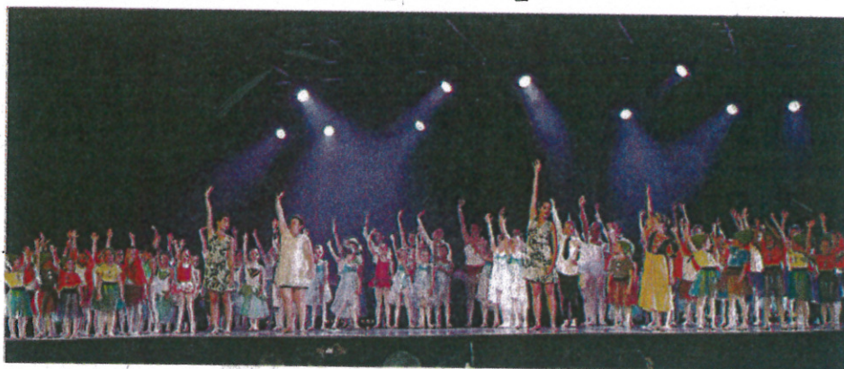
Quand la chorégraphie s'offre une grande scène.