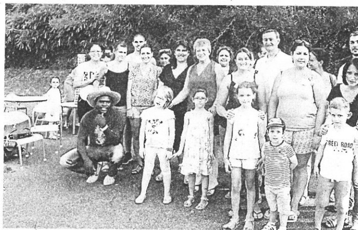
Le maire et les élus avec les parents et les enfants à l'accueil de loisirs.

Les jeunes Saint-Jeannais qui fréquentent l'accueil de loisirs sans hébergement (ex-centre de loisirs) sont vraiment très gâtés... Pas de quoi s'ennuyer durant ces deux mois de vacances tant les animations sont diverses et variées. Avec en plus de supers animateurs ! « Art Attitude » a été choisi comme thème fédérateur de cet été. Il permet aux enfants de découvrir et d'aborder l'art sous toutes ses formes (peinture, sculpture, théâtre, danse, cinéma, musique, architecture...). De nombreuses activités, en termes de sorties, sont aussi proposées aux jeunes Saint-Jeannais comme la piscine, les découvertes de la