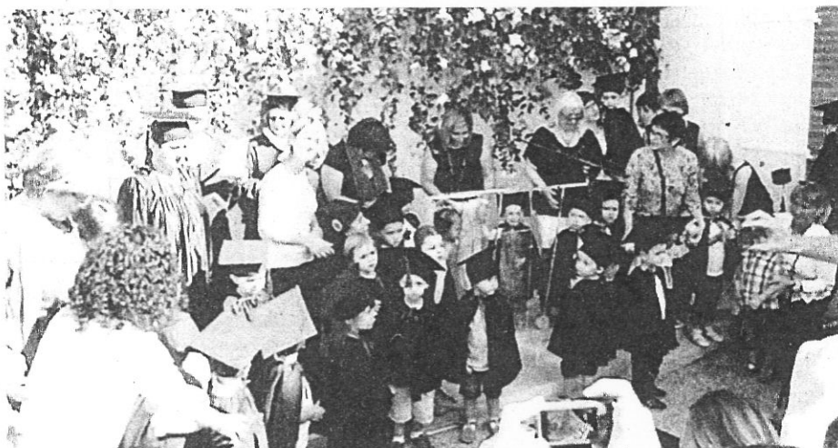
Les petits lauréats vont passer du Ram à l'école maternelle.