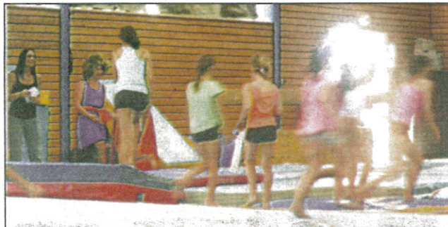
Le groupe de Danse Rythmique compétition