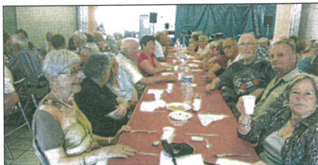
A la santé des retraités!