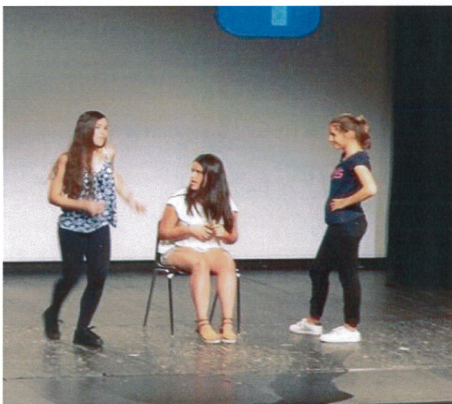
Les jeunes Européens ont présenté un spectacle avec pour thème les réseaux sociaux.

Publié le 25/07/2015 à 03:53, Mis à jour le 25/07/2015 à 09:08