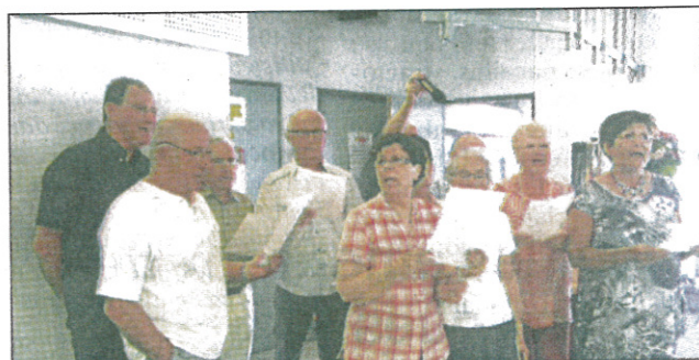
Les interprètes de l'Hymne de l'Age d'Or