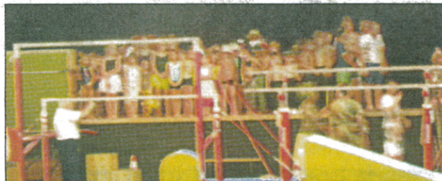
Une partie des jeunes gymnastes

C'était la fête du Saint-Jean Gymnique samedi ! Devant une salle René Cassin pleine de parents et amis des 400 adhérents du club, les gymnastes ont remonté le temps, de la préhistoire à nos jours. Tous les groupes, quel que soit leur âge, leur discipline et leur niveau, avaient préparé des chorégraphies qui ont enchanté le public. Le