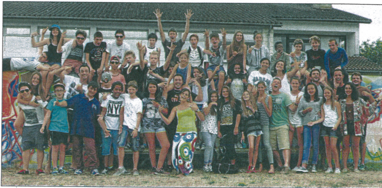
40 jeunes, 7 animateurs, et seulement 72 heures pour réaliser un court-métrage

C'est un sacré défi qu'ont relevé la semaine dernière les jeunes de la MJC de Saint-Jean ! Avec les MJC du Pont des Demoiselles, de Croix-Daurade, de Saint-Céré (Lot) et du PAJ de Mondonville, ce sont 40 jeunes et 7 animateurs qui se sont retrouvés avec une mission : réaliser en 72 heures un court-métrage avec un maximum de créativité. Première parti du défi, en un après-midi : trouver le scénario, les accessoires, distribuer les rôles... Le marathon s'est poursuivi sur la base de loisirs de Mézels,