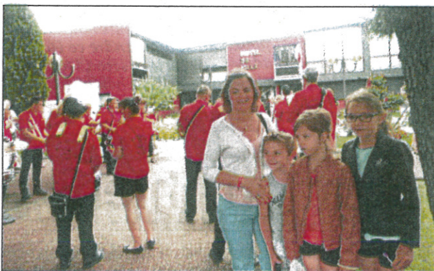
Samedi matin, réunion devant la mairie avec la Banda de l'Union