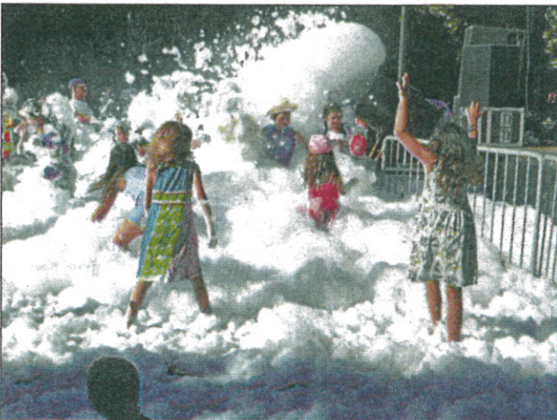
Trop chouette, la mousse!

Démarrées dans la mousse et en fanfare, les fêtes de Saint-Jean se sont terminées en apothéose dimanche soir avec le feu d'artifice en musique tiré depuis les rives du Lac de la Tuilerie. La soirée mousse -une nouveauté du programme saint-jeannais- a fait l'unanimité, aussi bien auprès des enfants, qui ont lancé la soirée, qu'auprès des adultes. Samedi matin, la