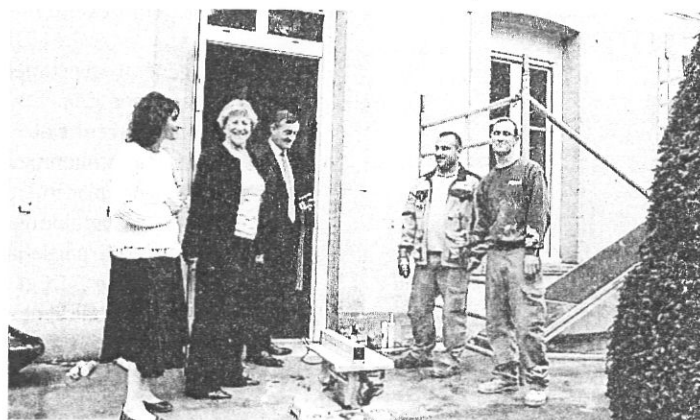
Visite de chantier des élus lors de la pose des nouvelles menuiseries.

Ce sont maintenant des volets roulants qui ont pris le relais sur cette très belle maison de maître édifiée au XIX e siècle. « Sur le plan esthétique le résultat est remarquable. J'avais au départ