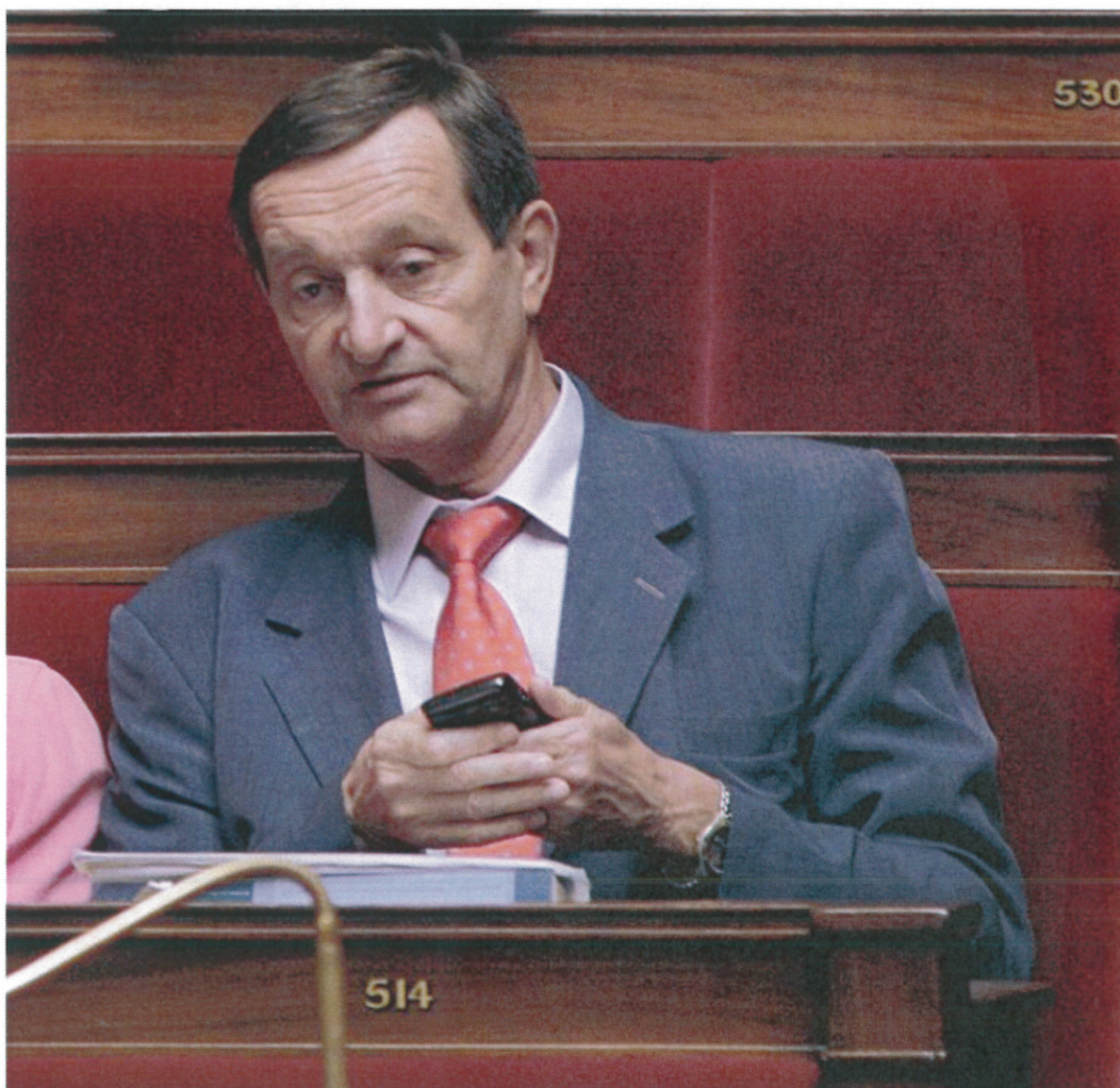
Le député socialiste et rapporteur du projet de loi de financement de la sécurité sociale (PLFSS) pour 2015, Gérard Bapt, sur les bancs de l'Assemblée nationale, à Paris, le 27 septembre 2011

AFP 30 octobre 2014 à 16:43 (Mis à jour : 30 octobre 2014 à 21:24)