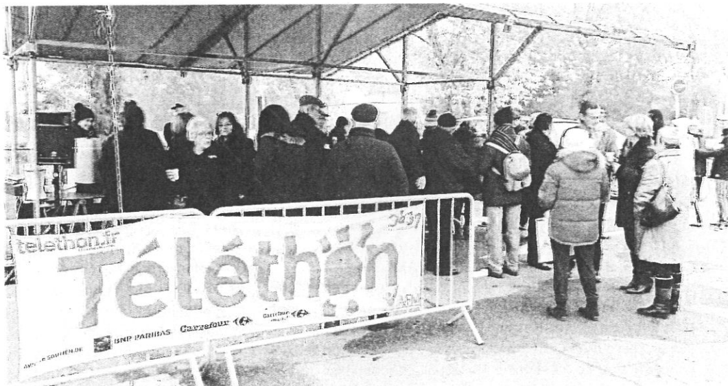
Nombreux visiteurs autour du chapiteau de l'OMS.

Du 5 au 7 décembre se dérouleront les journées nationales consacrées au Téléthon. L'Office municipal des Sports et la mairie rassemblent plusieurs associations qui organisent diverses activités. Ainsi dès le vendredi 5 décembre, à partir de 20 h 30, l'école de musique ADMNET et l'ensemble vocal Amplitude offrent un concert en l'église paroissiale.