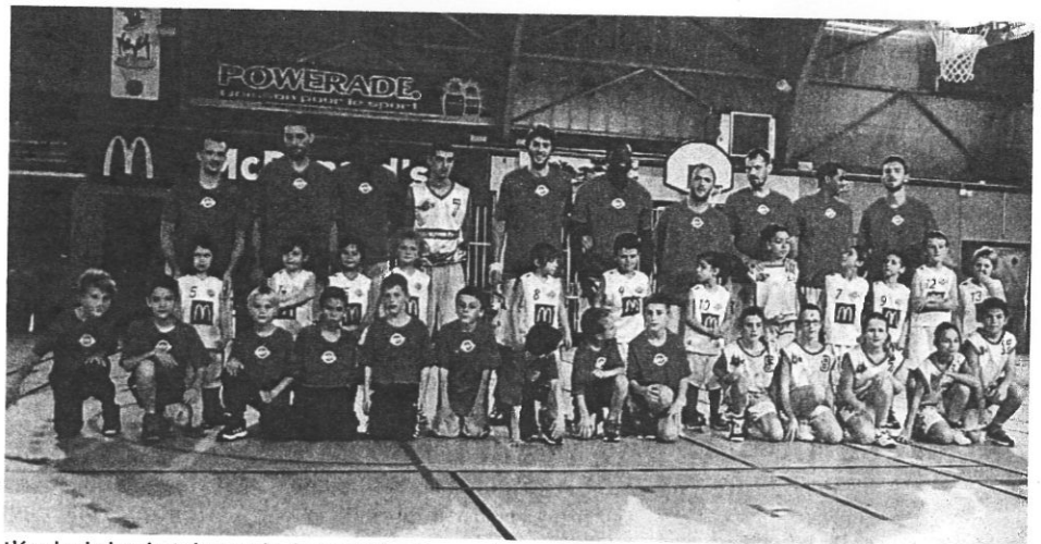
L'école de basket du NET'S devant l'équipe senior 1 garçons.

Vice-championne des Pyrénées la saison passée, c'est un nouveau look que présente cette année l'équipe de basket senior garçons 1 du NET'S. Avec les nombreux joueurs arrêtés et partis parmi les anciens, la nouvelle équipe a entamé ce championnat très relevé avec les intentions de faire aussi bien, si ce n'est mieux, que la saison dernière. Pour ce début de saison, l'équipe ne s'est inclinée que deux fois dont en match aller face à Villefranche, qui est le favori du championnat. Elle compte à ce jour quatre victoires qui la classent dans le haut du tableau. Samedi soir, devant un public venu nombreux, c'est Ramonville qui venait dans la salle Belbèze défier les locaux avec l'espoir de renouveler la victoire de l'année dernière. Après une bonne entame du NET'S, les visiteurs reviennent au score à la mi-temps, 23 partout. Grâce au superbe 3 e quart temps, le NET'S reprend le pas sur les visiteurs, ils assurent la victoire par un score fi-