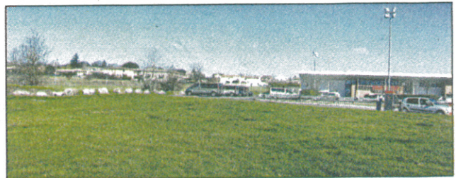
Les espaces de verdure proches d'Intermarché sont sauvés!

En 2009, le projet de construction d'un Best-Hôtel dans les quartiers sud de Saint-Jean avait fait l'unanimité contre lui: les habitants des rues Marie Curie, Jean Perrin et Denis Papin, bientôt rejoints par l'association du Domaine des Pins, puis par celle du Parc Saint-Jean, avaient lancé une pétition contre ce « bloc de béton » et