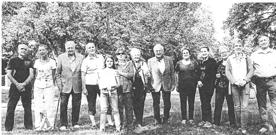
Quelques participants dans le parc du château.

Sous les frondaisons du parc du château de Loubens, le repas, juste au pied des tours majestueuses, la bonne humeur, autour des mets apportés par chacun, ont été une mise en condition agréable avant la visite de cette maison historique mais néanmoins familiale. Après un diaporama très explicite, guidés par la marquise d'Orgeix, les participants ont particulièrement apprécié les diverses