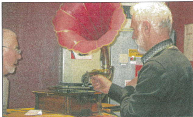
Le phonographe à pavillon prêté par un particulier