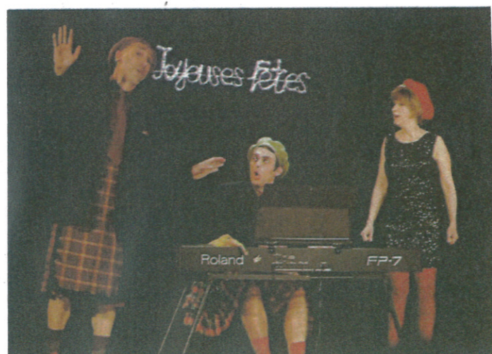
Le trio des Cyranoïaques.

Le spectacle musical « C'est idiot ! Cabaret Crétin... » sera présenté vendredi à 21 heures, à l'Espace Palumbo par la C ie Les Cyranoïaques. Si les mystères de la vie vous mettent à zéro, n'y pensez pas, n'y pensez pas trop ! Trois Cyranoïaques — un ténor, ténor sur le retour, une soprano à la tessiture incertaine et un pianiste blond frappeur de clavier électrique — entreprennent l'inventaire de l'idiotie dans la chanson : programme ambitieux traduisant lui-même une incommensurable crétinerie. Ils n'épargneront ni la chanson d'enfant, ni la chanson engagée, ni même le répertoire classique ! « La frontière entre les bons sentiments et la mièvrerie est souvent fragile, et l'usage forcené du dictionnaire des rimes fait de gros ravages dans les textes mis