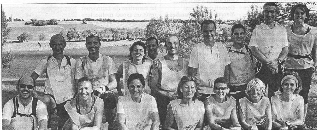
Les participants à la Ronde des Foies Gras

Les Pieds Lurons ont faim de compétition! Dimanche 12 octobre, les coureurs saint-jeannais étaient 17 à participer à la Ronde des Foies Gras à Mauvezin, dans le Gers. Au lâcher de canard donnant le signal du départ, les 17 se sont élancés pour 24 km à travers a campagne gersoise: chemins de terre,