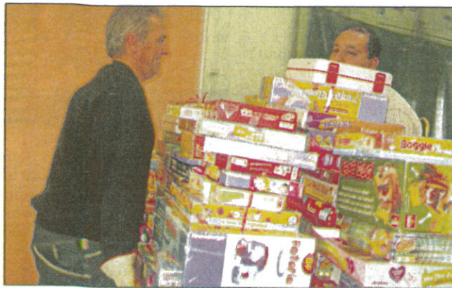
Des jouets par milliers!

Ce samedi 29 novembre de 9h à 13h , le Centre Communal d'Action Sociale (CCAS) organise sa traditionnelle