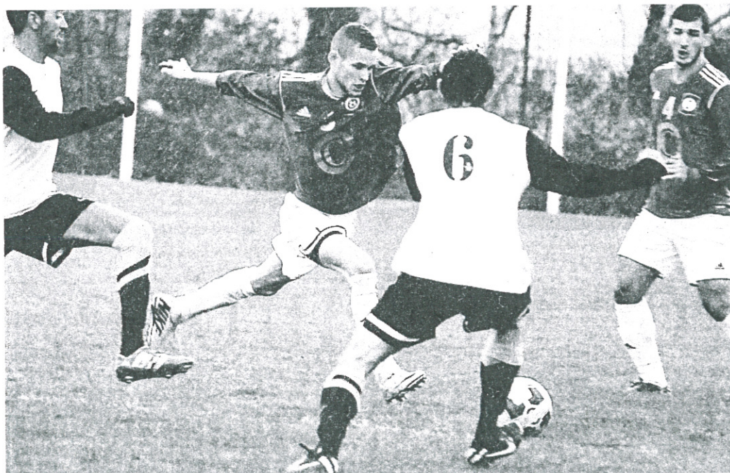
Les Toulousains ont enfin mis un arrêt à leur série de cinq défaites.

Mais dans une partie gangrenée par les fautes, Saint-Simon aura finalement réussi à stopper l'hémorragie. Deux points que l'Étoile empêche bien volon-