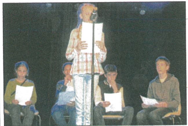
Lecture de lettres de Poilus par de jeunes saint-jeannais