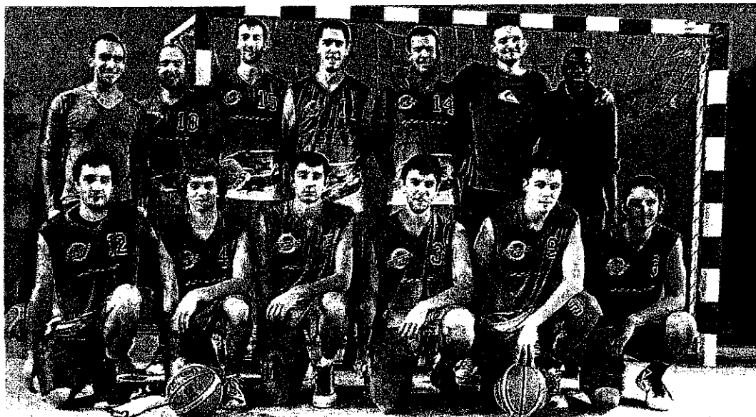
L'équipe seniors 2 en haut du classement

Dans le même temps, l'équipe seniors garçons 2, en